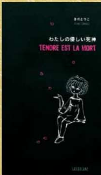
Prix LIBBYLIT 2009 Meilleur album : KINOTORIKO