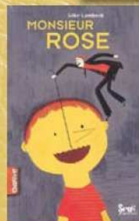
Mention spéciale LIBBYLIT 2009 : SILKE LAMBECK